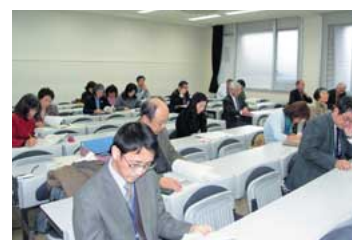
第1回教養教育・科目を考える懇話会1月27日)