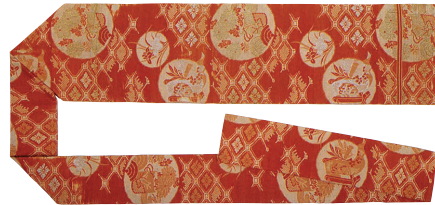
上/越原記念館外観。 下/春子で作った名古屋帯。 学校法人越原学園（名古屋女子大学）所蔵。